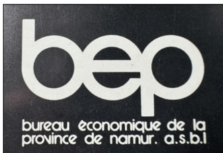
Premier logo du BEP

des législations antérieures ou connexes » 5 . « C'...(était)... donc d'un véritable réseau législatif ...(fournissant)... les outils d'une politique dont la finalité ...(était)... identique : l'expansion économique de nos régions » 6 .