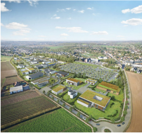
Parc d'activités Santé à Bouge

défini de développement de notre économie nationale.