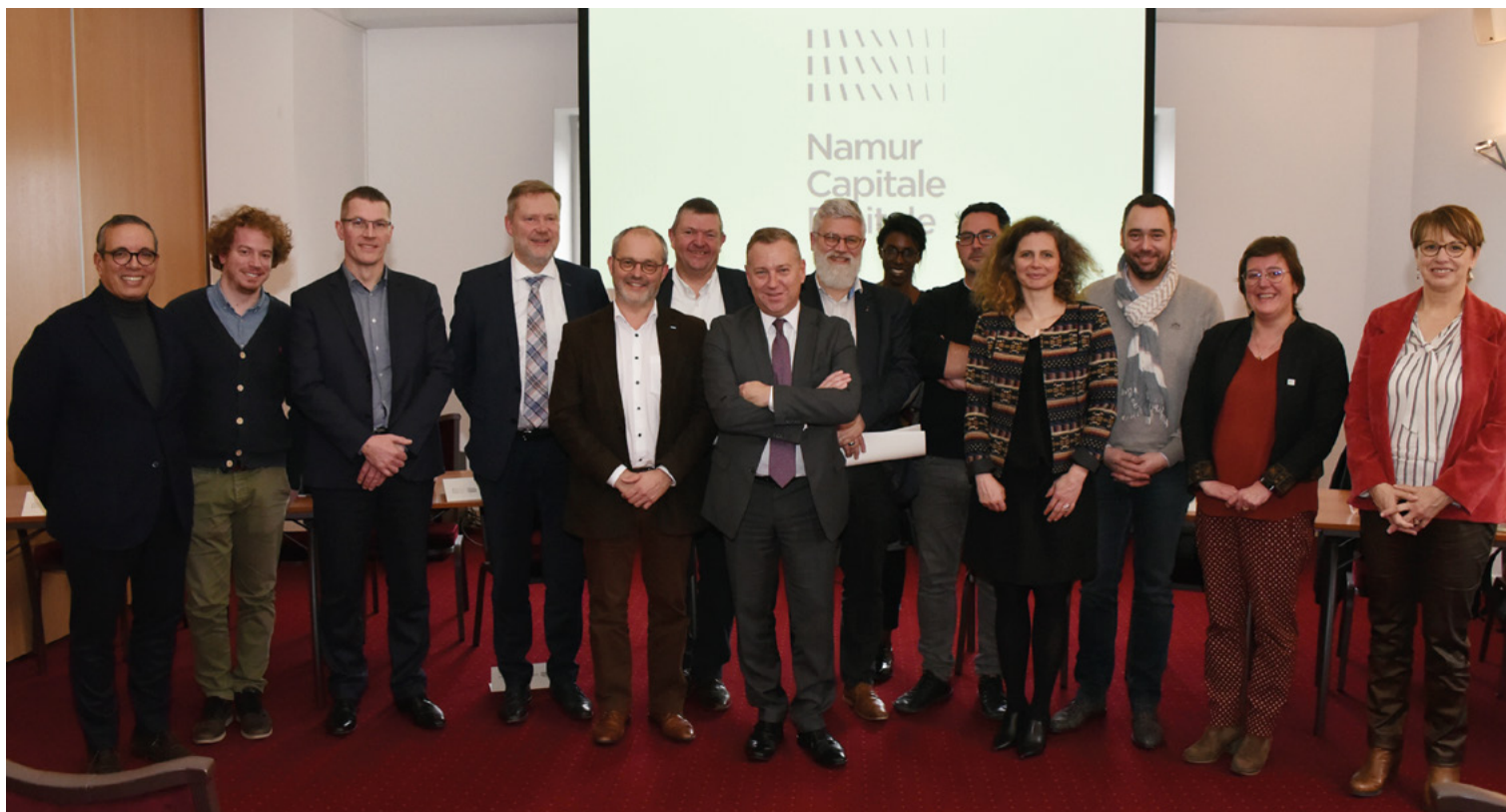
Présentation du label «Namur Capitale Digitale» au Cercle de Wallonie, le 14 janvier 2020

d'échanger sur les différents projets de chacun mais surtout afin de maintenir le lien qui les unit à travers ce label. Deux nouveaux chantiers à explorer ont marqué en particulier cette réunion : l'E-santé et l'E-environnement (Green Deal). Pour plus d'informations sur le label : https://www.bep.be/namur-capitaledigitale . Les acteurs du numérique, dont le projet s'inscrit dans la dynamique du label sont invités, par ce lien, à communiquer sur leurs intentions et événements liés au digital » 19 .