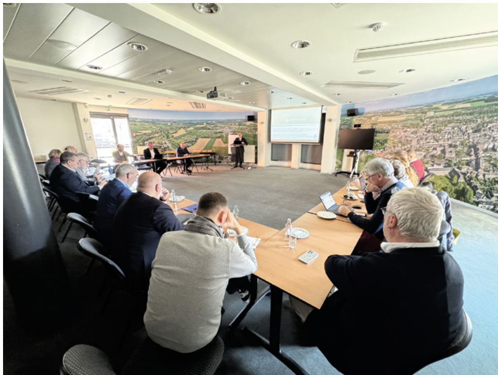
Réunion d' Axud

Pourtant, je continue de penser que sur des sujets qui sont sans doute à resserrer, à bien préparer et à choisir judicieusement, réamorcer cette pompe à idées-là pour trois provinces tout aussi différentes dans leurs caractéristiques que complémentaires dans leurs préoccupations, dans leurs forces